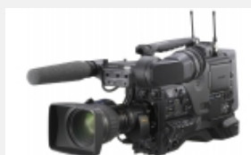
PDW-700 Videocámara XDCAM HD422 con tres sensores CCD Power HAD FX de 2/3" y grabación en Full HD (más SD opcional)