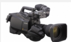
HSC-100RF Cámara HD/SD portátil con tres sensores CCD Power HAD FX de 2/3" que permiten el funcionamiento a través de fibra