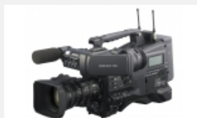
PMW-400K Videocámara XDCAM con zoom HD 16x con tres sensores CMOS Exmor de 2/3" y grabación XAVC HD a 100 Mbps y MPEG HD 4:2:2 a 50 Mbps