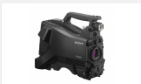
HXC-FB75H Cámara de estudio Full HD/SD asequible con tres sensores CMOS Exmor de 2/3"