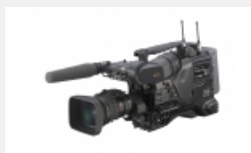
PDW-850 La más avanzada videocámara XDCAM HD422 Professional Disc con tres sensores CCD Power HAD FX de 2/3" ofrece la mejor calidad de imagen, así como un intercambio y archivo de soportes sencillo