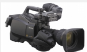
HSC-300R Cámara HD/SD portátil con tres sensores CCD Power HAD FX de 2/3" que permite el funcionamiento con cable triaxial digital y opciones de lentes grandes