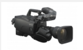
HDC-4300 Cámaras de sistema 4K/HD