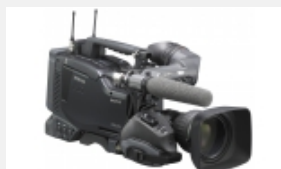
PDW-F800 Videocámara XDCAM HD422 con tres sensores CCD Power HAD FX de 2/3 pulgadas de alta gama y grabación en Full HD / SD