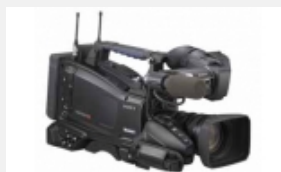
PMW-320L Videocámara XDCAM EX con tres sensores Exmor CMOS de 1/2 pulgadas, sin lente y con grabación en Full HD / SD